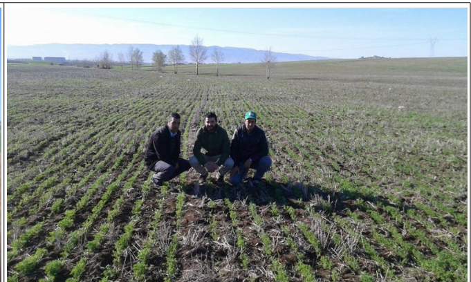
Semis de lentilles derrière chaumes de blé (Sétif).