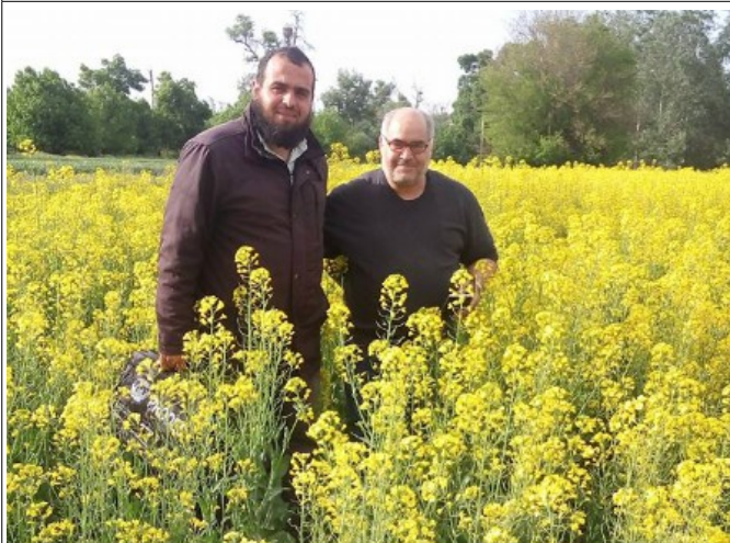
Parcelle de colza (ITGC).