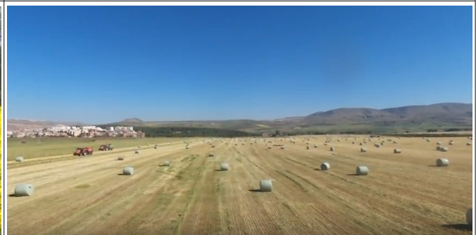
Enrubannage du fourrage (Axium Constantine).

Des propositions concrètes immédiatement applicables sur le terrain.