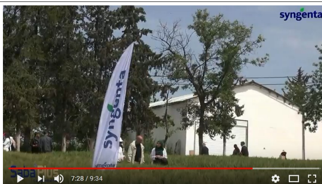
Organisation d'essais agronomiques par la firme Syngenta - Algérie

Question : pourquoi ne pas envisager à l'avenir une participation de ces firmes au financement des instituts techniques comme c'est le cas en France avec Arvalis.