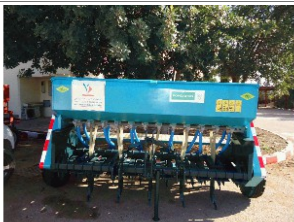
Un semoir au prix modique..