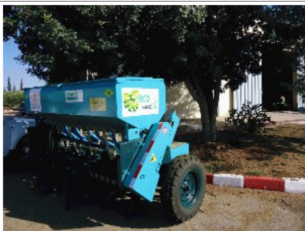
Semoir fabriqué par ATMAR (Maroc).