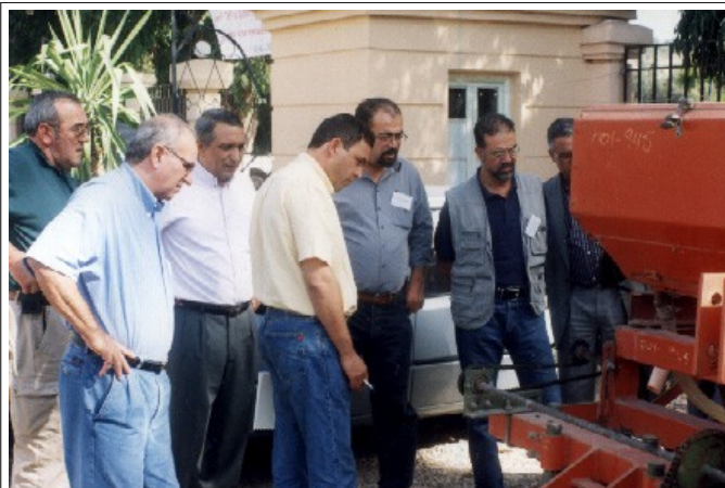
Une collaboration entre INRA et ATMAR.