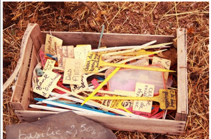
La caisse d'étiquettes de Pascal Poot, le 26 février 2015