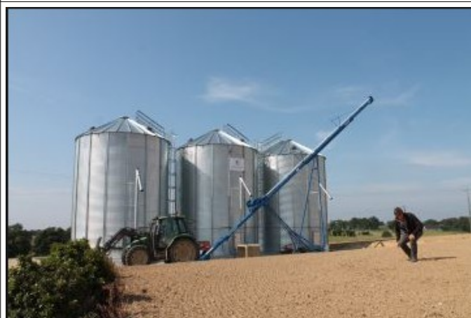
Stockage à la ferme.

Légende substances actives: PMM: pyrimiphos-méthyle; CPM: chlorpyrifos-méthyle; DM: deltaméthrine; CYP: cypeméthrine; Pyr Nat: Piréthrines naturelles; pbo: butoxyde de pipéronyle; METH: méthoprène.