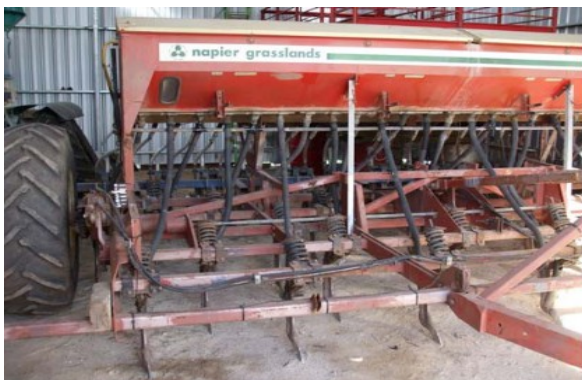
Semoir pour semis direct.

(s'inspirer de ce qui peut nous être utile...)