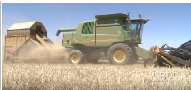
Récupération des menues paille et des semences de mauvaises herbes.