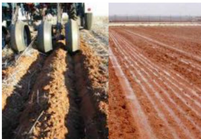
Figure 28. This Australian press wheel has a wide angle creating a large and stable furrow surface shape (right) which can 'harvest' water during small rainfall events and concentrate it near the seed (left).