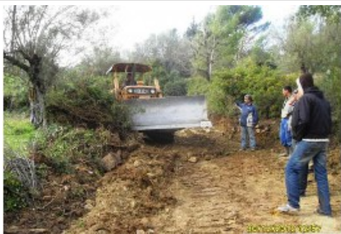
Ouverture d'une piste en zone de montagne (Algérie)

Manuel de survie pour les néo-ruraux se lançant dans une activité agricole ou agro-alimentaire.