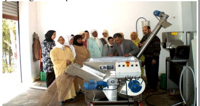
Huilerie artisanale (Maroc).

La commercialisation est un métier à part entière. Internet peut faciliter les choses. La demande locale est forte. Par ailleurs, l'export peut être une solution. Le marché français est structurellement déficitaire alors que l'engouement pour l'huile d'olives est très fort.