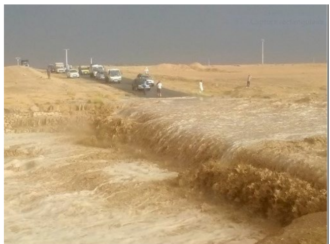
Oued en crue (Algérie).

A l'intérieur du pays, l'approvisionnement en eau passe par la création d'obstacles permettant l'épannage des crues. Ces ouvrages permettent également une recharge locale de la nappe phréatique et donc un meilleur débit des puits.