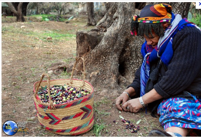
Récolte traditionnelle des olives en Kabylie