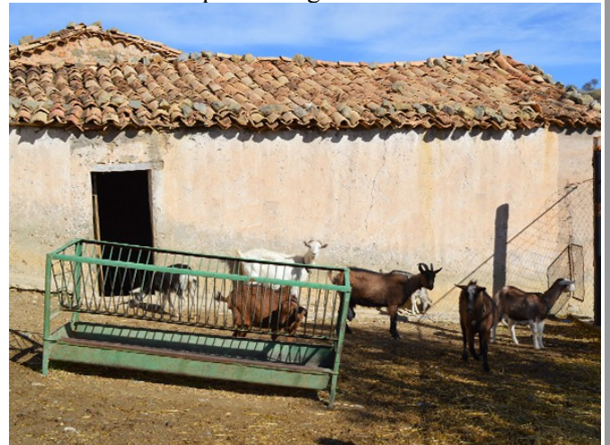
Elevage de chèvres

Vous êtes vraiment décidé à ne plus subir la ville et votre chef de service. Nous vous proposons ce tour d'horizon de quelques activités agricoles ou de transformation de produits agricoles.