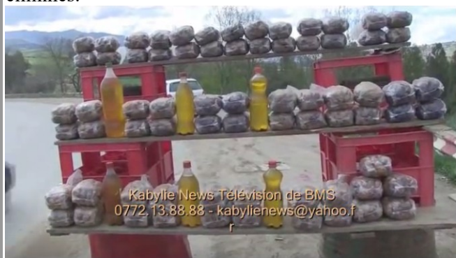
Vente d'huile d'olive en bordure de route (Tizi-Ouzou).

La vente directe est très intéressante pour un agriculteur. En effet, les intermédiaires sont totalement éliminés.